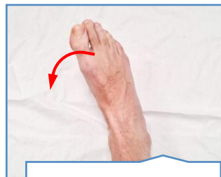
Cara a un lado