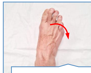
Cara ao outro